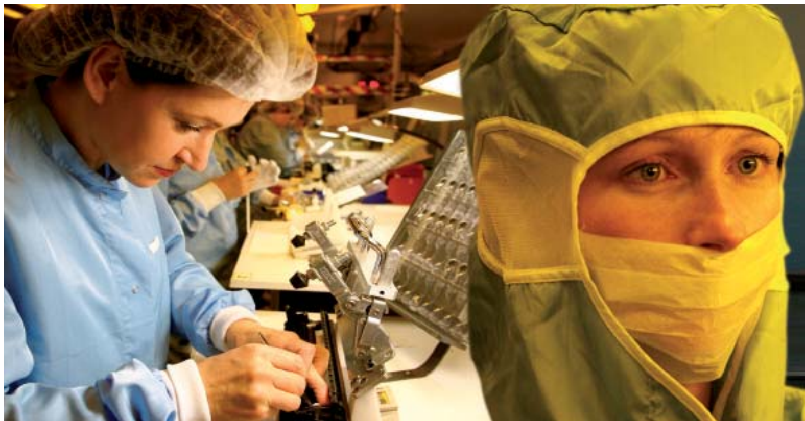
Assemblage des cartouches