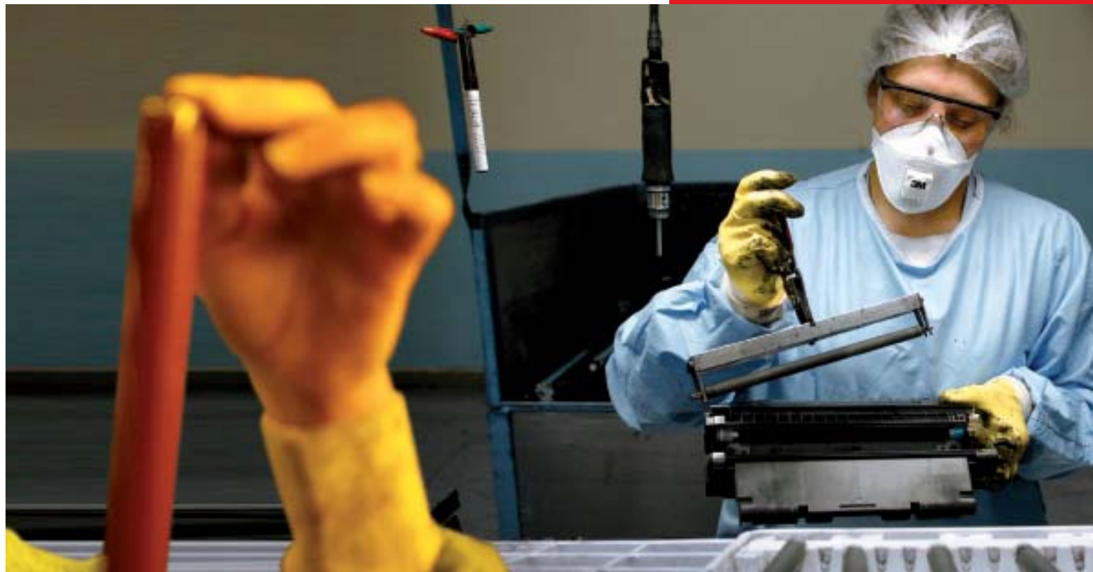
Démontage des cartouches