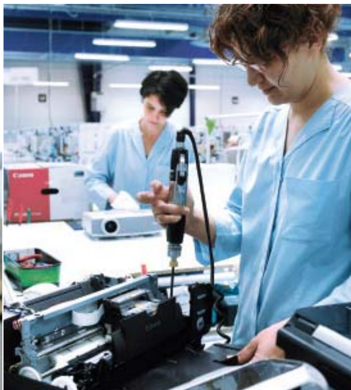
Atelier Agréé Régional Canon