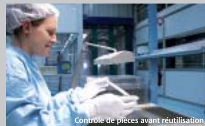
Contrôle de pièces avant réutilisation

Le broyage et le tri automatique des matières permettent de valoriser des métaux comme l'acier, l'aluminium et les plastiques. La réalisation d'ardoises synthétiques de couverture constitue l'une des valorisations effectuée par Canon Bretagne à partir de matières plastiques mélangées.