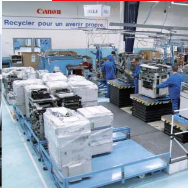
Démantèlement de produits fin de vie