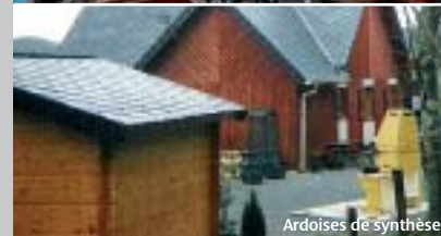
Ardoises de synthèse