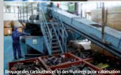
Broyage des cartouches et tri des matières pour valorisation