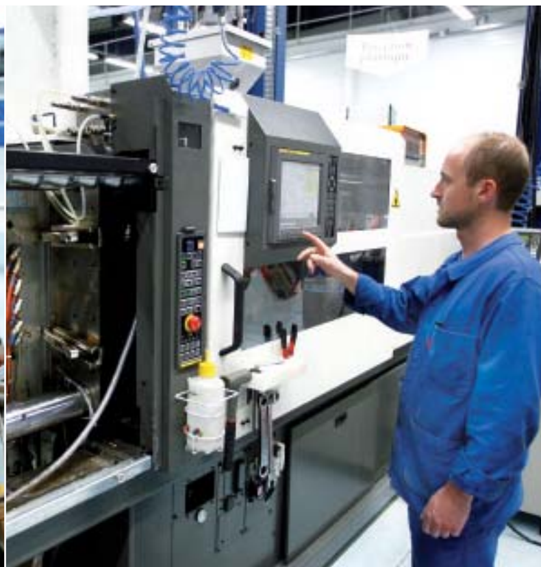
Injection plastique et usinage