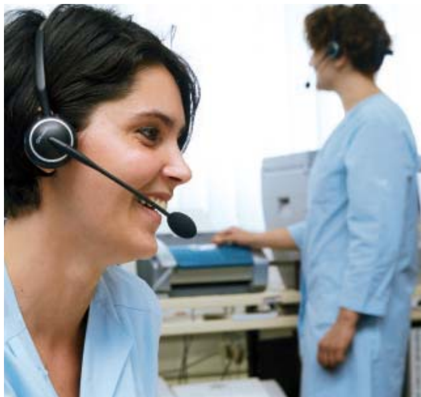
Centre d'appels & réparation